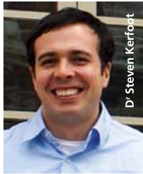
D r Steven Kerfoot

Lancé en 2008, le Réseau de recherche et de formation stopSP est une initiative nationale ayant pour but d'accélérer le rythme des découvertes réalisées au Canada dans le domaine de la SP. En janvier 2010, le Réseau a annoncé avec fierté que la D re Cornelia Laule, de l'Université de la Colombie-Britannique, et le D r Steven Kerfoot, de l'Université Yale, étaient les premiers titulaires des bourses de transition études-carrière stopSP. Ces bourses de 500 000 $ chacune permettent aux postdoctorants et aux stagiaires en formation clinique méritants de financer leurs deux dernières années d'études postdoctorales liées à la SP et leurs trois premières années d'occupation d'un premier poste de professeur en lien avec la SP dans un établissement canadien.