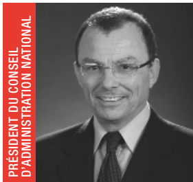
PRÉSIDENT DU CONSEIL D'ADMINISTRATION NATIONAL