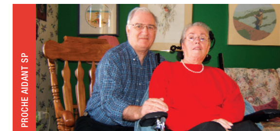
PROCHE AIDANT SP

En prenant en compte sa participation au Marathon de golf 2008, ses dons personnels et ceux de ses contacts, son apport à la cause avoisine les 130 000 $.