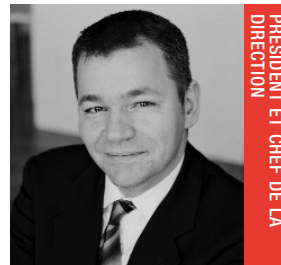
PRÉSIDENT ET CHEF DE LA DIRECTION