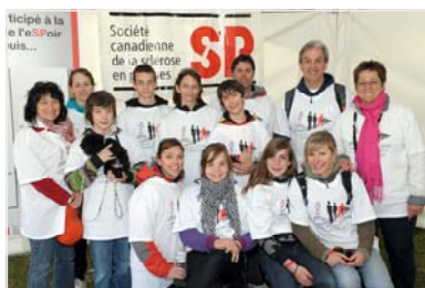
LES FRANFRELUCHES VIRILES, MONTRÉAL