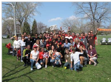
LES SPIDERS, LAVAL