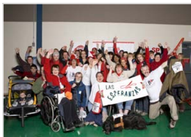
LAS ESPERANZAS, TROIS-RIVIÈRES