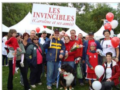
LES INVINCIBLES, QUÉBEC