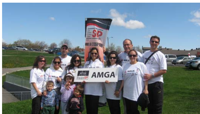
Amga — Marche de Laval