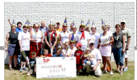
Les Joyeux Marcheurs Alma