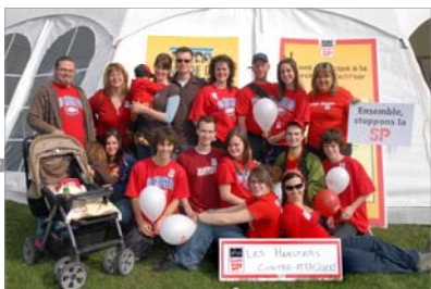
Les Hamsters contre-attaquent Montréal