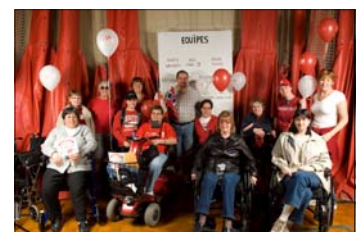
West Island Roadrunners Banlieue Ouest de Montréal