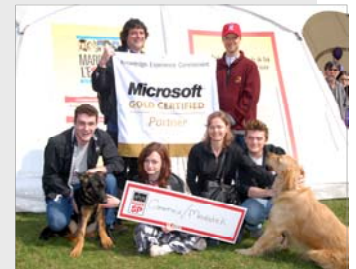
Montreal Microsoft Super Partners, Montréal