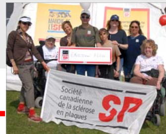
Ericsson Elite Montréal