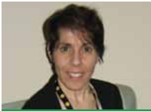
Nardina, après l'intervention contre l'IVCC.

D e nos jours, les personnes aux prises avec la SP ont plus de choix que jamais en ce qui concerne le traitement de la SP et des symptômes de cette maladie.